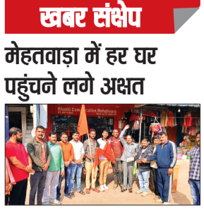
खबर संक्षेप मेहतवाड़ा में हर घर पहुंचने लगे अक्षत