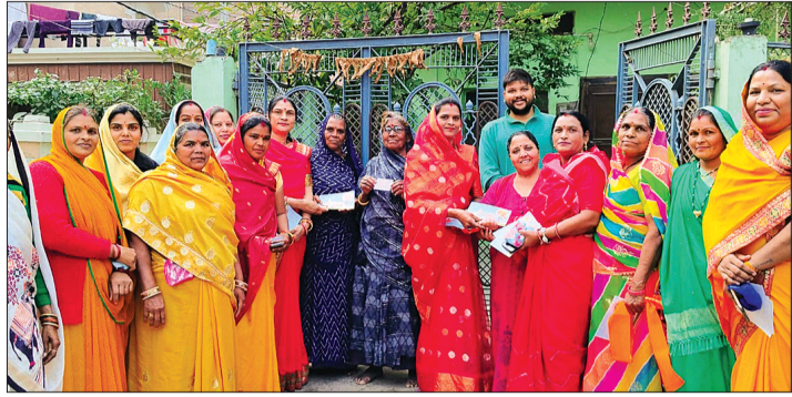
राधा कृष्ण मंदिर से हनुमान चालीसा का पाठ कर शुरू किया गया अक्षत वितरण। हरिभूमि न्यूज || आष्टा

जिस मंदिर का इंतजार हिंदुओं की कई पीढ़ियां कर रही थीं वो अब बनकर तैयार हो चुका है और भव्य व्यवस्था के साथ 22 जनवरी 2024 को राम लला अयोध्या के नए मंदिर में विराजमान होंगे। इस शुभ कार्यक्रम के लिए पूरे देश में निमंत्रण बांटा जा रहा है। अक्षत और श्रीफल के साथ अयोध्या से निमंत्रण आष्टा भी पहुंचा है। अक्षत हल्दी निमंत्रण बाटने के लिए महिलाओं से पुरुष, बच्चे भी बड़ी संख्या में शामिल हो रहे हैं। ऐसे में आष्टा शहर वर्तमान में पूर्ण रूप से राममयी दिखाई दे रहा है यहां लोगों में भारी उत्साह और उमंग देखने को मिल रहा है। स्थानियों का कहना है हम सभी हिंदू भाई इस पल का वरिष्ठ से इंतजार कर रहे थे। हमारी कई पीढ़ियां बीत गईं, लेकिन आज वो मंगल दिन के हम साक्षी बनने जा रहे हैं। हम सभी बहुत खुश हैं और अपने आप को भाग्यशाली मान रहे हैं कि हम राम मंदिर काल में जीवन्त जीने का अवसर प्रभु ने दिया है। काछी पूरा राधा कृष्ण मंदिर से शुरू हुआ अक्षत वितरण कार्यक्रम में विश्व हिंदू परिषद, बजरंग दल एवं स्वयंसेवक संघ के साथ कुशावाह समाज के वरिष्ठ जनों के मार्गदर्शन में रामलला के भी इस कार्य में अपना सहयोग कर रहे हैं।